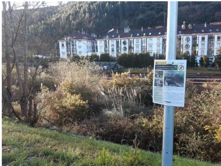
Vista de la zona al inicio de los trabajos