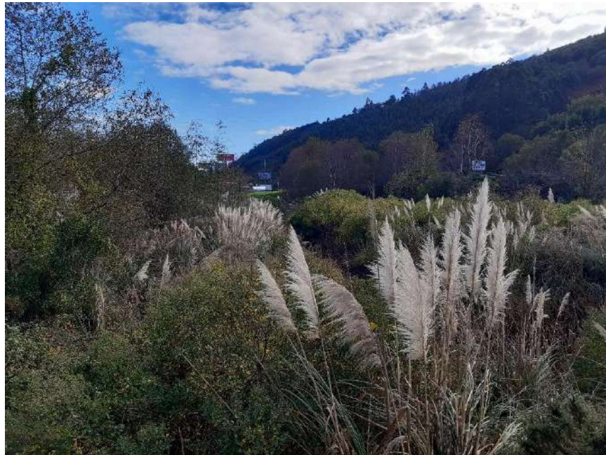
Vista aguas arriba de la zona de actuación