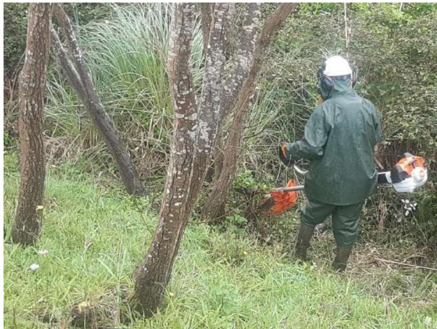
Trabajos de retirada de Cortaderia selloana con desbrozadora