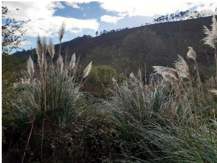
Ejemplar de la especie exótica invasora Cortaderia selloana