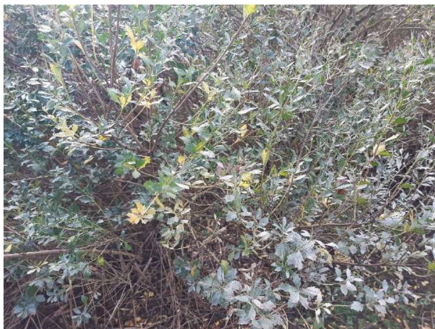
Ejemplar de la especie exótica invasora Baccharis hamilifolia