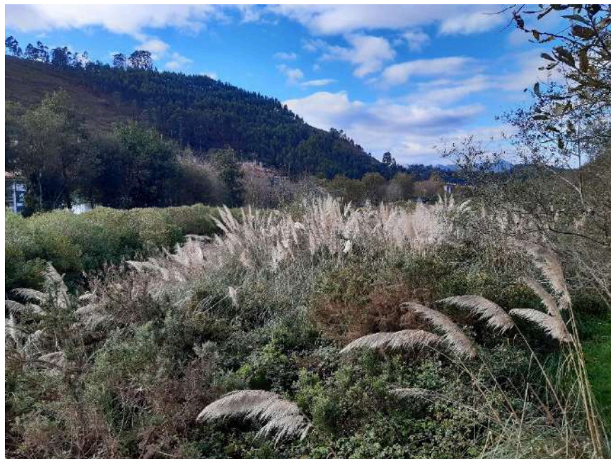
Previo a la actuación, vista de la zona de actuación, aguas abajo