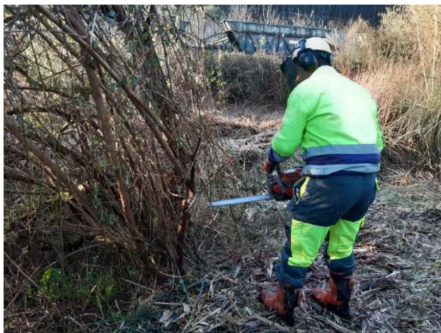
Trabajos de retirada de Baccharis hamilifolia con motosierra