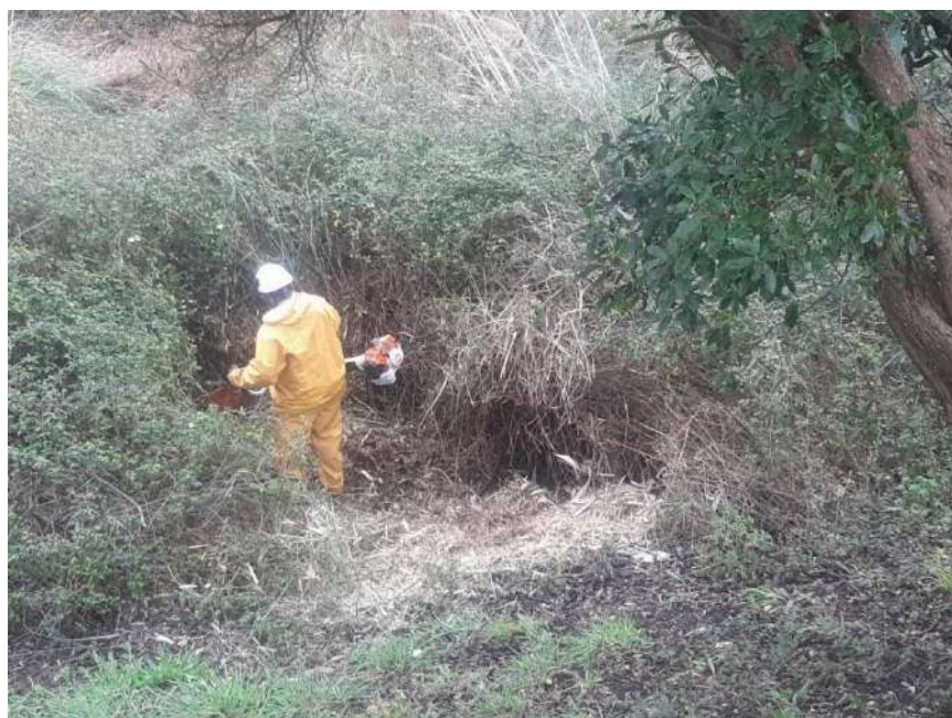
Trabajos de retirada Cortaderia selloana con desbrozadora